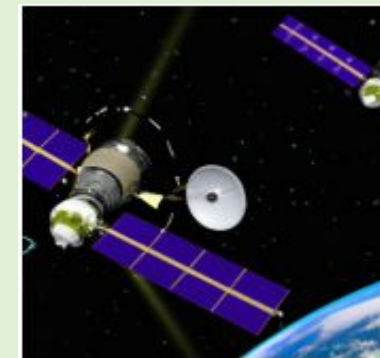
On-Orbit Collision Avoidance Support Service, a safer Space supported by Space Situation Awareness (SSA) Systems