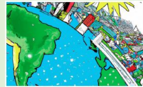
Smart Cities in the Context of Latin America: Space-based Solutions