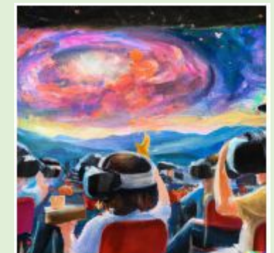
Metaverse and Space Education